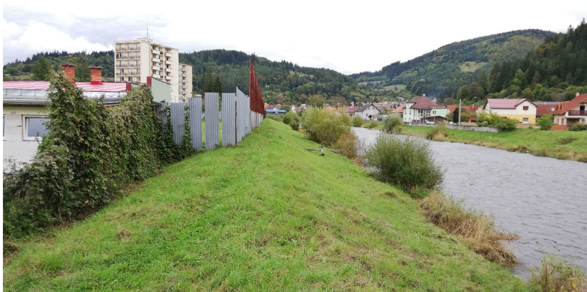
Foto 37 – Intravilán Brusno, hrádza pri futbalovom ihrisku na pravom brehu Hrona, miestna časť Ondrej n/H V mieste charakteristického rezu SVR A8-1