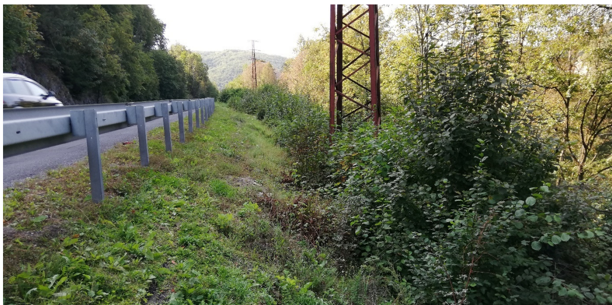
Foto 19 – Rozhranie extravilánu Lučatín/Medzibrod, svah cesty I/66 pri rieke Hron, lokalita Predľubietová V mieste charakteristického rezu VR A-19