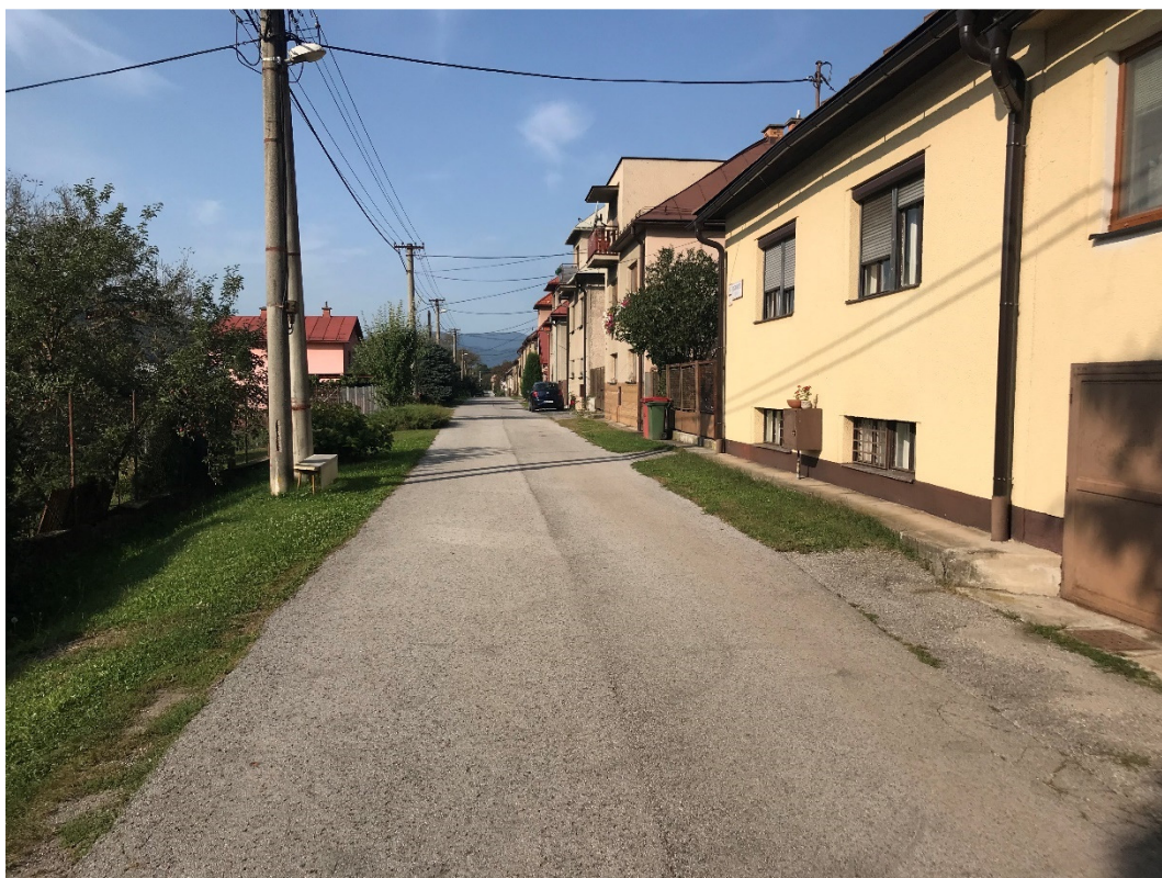
Foto 4 - Mestská časť Banská Bystrica – Šalková, miestna komunikácia V mieste charakteristického rezu VR A-4