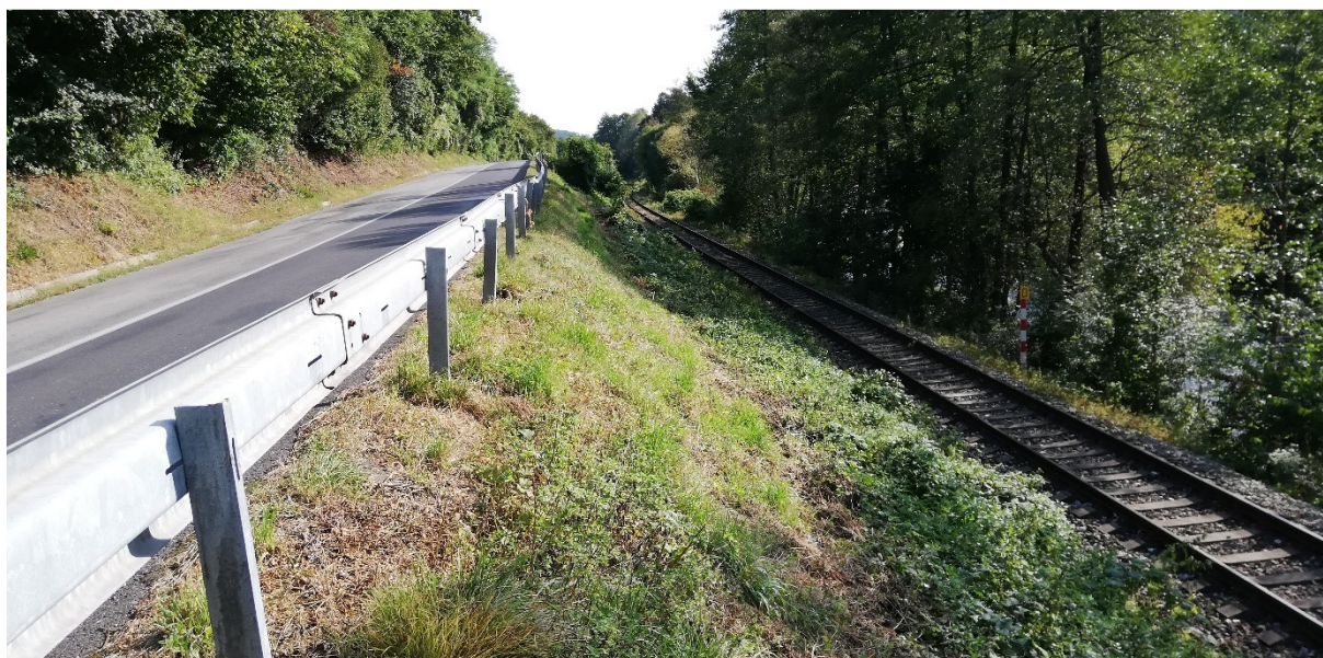
Foto 15 – Extravilán Slovenská Ľupča, súbeh cesty III/2427 so železnicou, rozhranie katastrov Slovenská Ľupča /Lučatín V mieste charakteristického rezu VR A-15