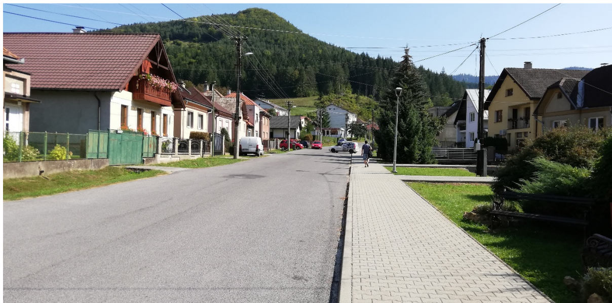
Foto 54 – Intravilán Brusno, ulica Kúpeľná – v jednej trase s variantom A (rovnaké ako foto 24) V mieste charakteristického rezu VR B-17