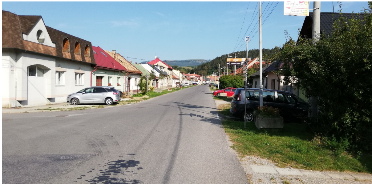
Foto 25 – Intravilán Slovenská Ľupča, ulica Hronská V mieste charakteristického rezu SVR A1-1