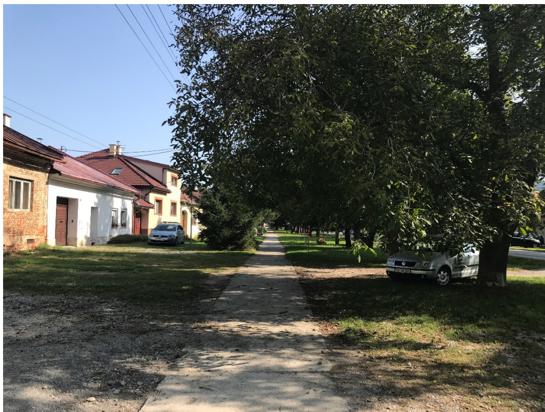
Foto 12 – Intravilán Slovenská Ľupča, centrum obce chodníkmi a cestou III/2427 V mieste charakteristického rezu VR A-12