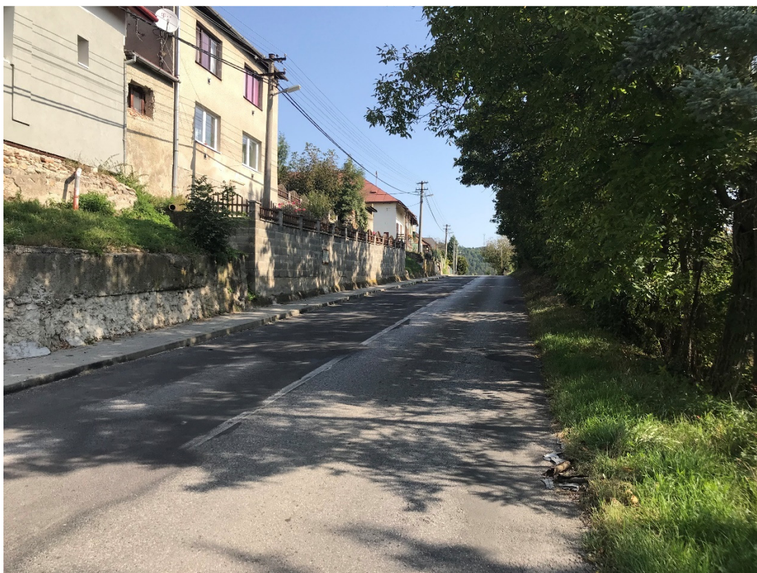
Foto 13 – Intravilán Slovenská Ľupča, prietah cesty III/2427 obcou V mieste charakteristického rezu VR A-13