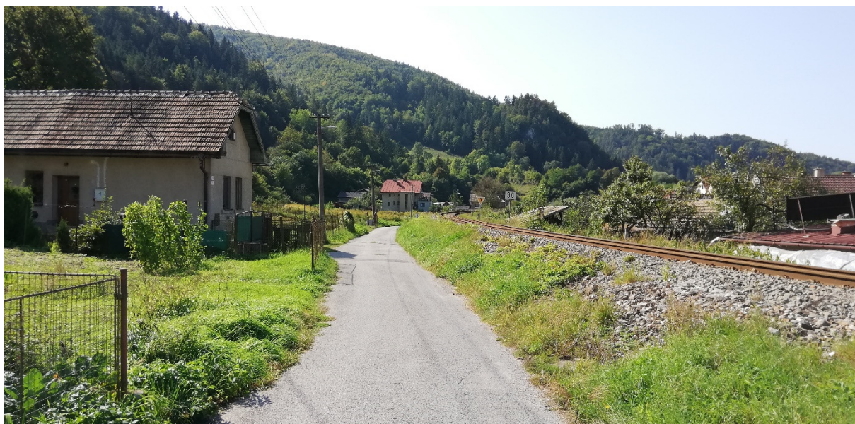
Foto 53 – intravilán Brusno, miestna komunikácia pri železnici, ulica Pod Strážňou V mieste charakteristického rezu VR B-16