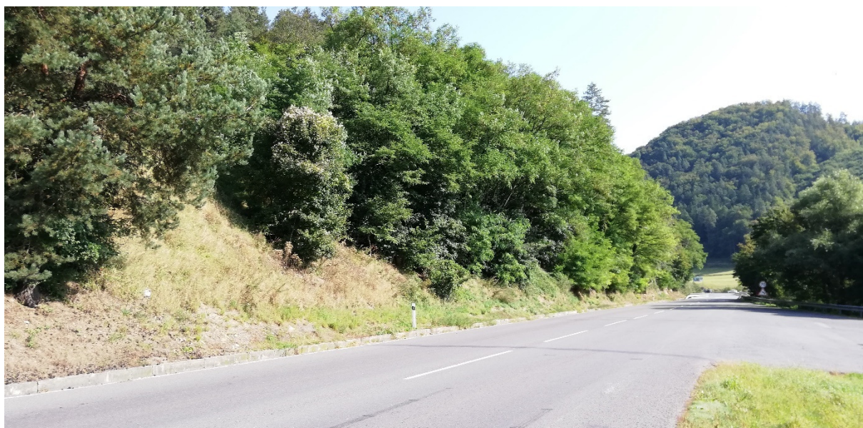
Foto 18 – Extravilán Lučatín, cesta I/66 pri križovatke s cestou III/2427, lokalita pri Lučatínskej skale V mieste charakteristického rezu VR A-18