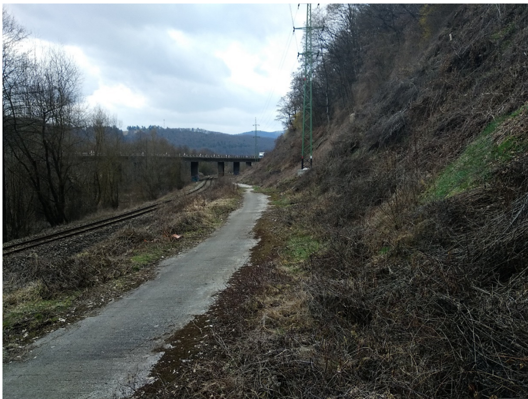
Foto 5 – Rozhranie katastrov Šalková/Slovenská Ľupča, poľná cesta v lokalite Príboj V mieste charakteristického rezu VR A-5