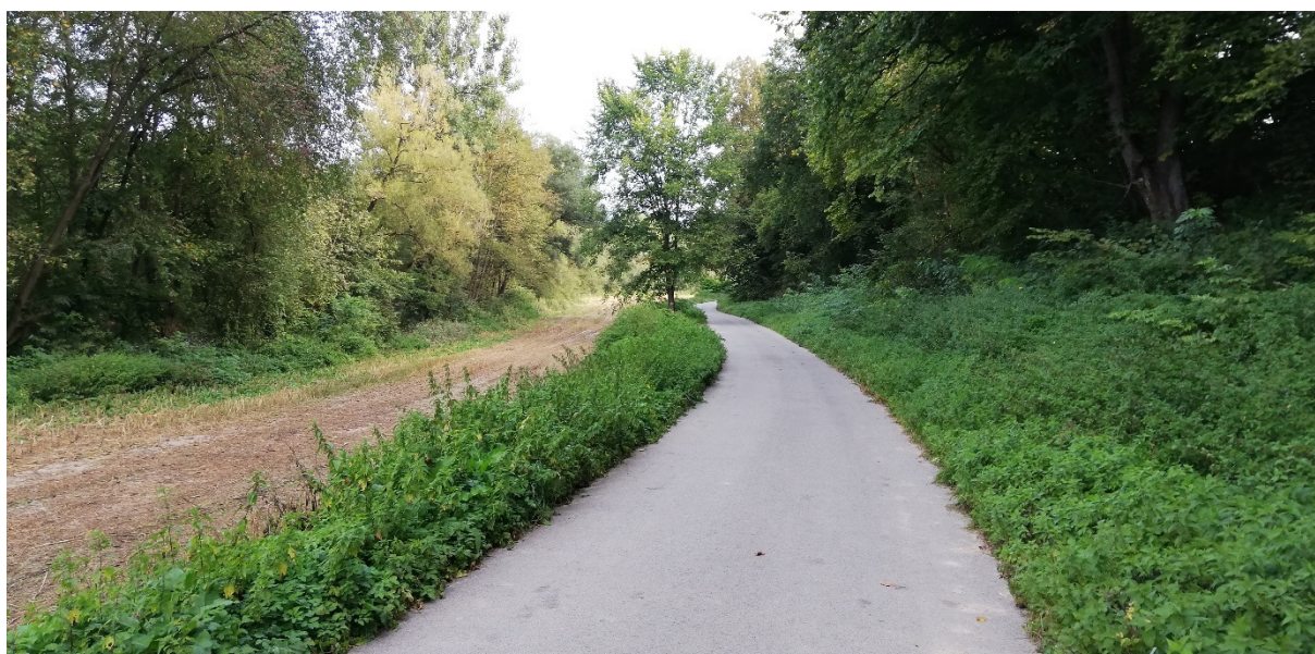
Foto 43 – Extravilán Slovenská Ľupča, lesná cesta na ľavom brehu Hrona V mieste charakteristického rezu VR B-6