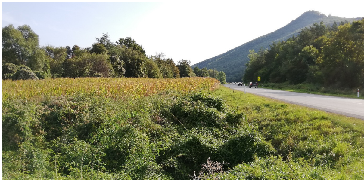
Foto 46 – Extravilán Lučatín, ľavý breh Hrona pri ceste I/66 V mieste charakteristického rezu VR B-9