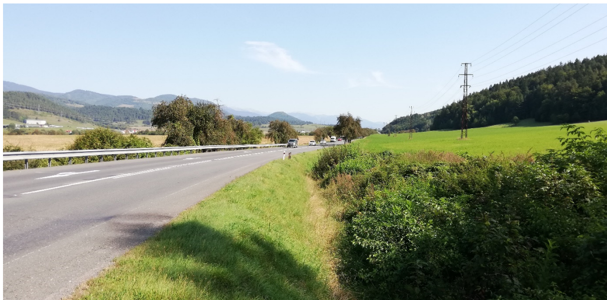
Foto 50 – extravilán Medzibrod, údolie Hrona pri ceste I/66 V mieste charakteristického rezu VR B-13