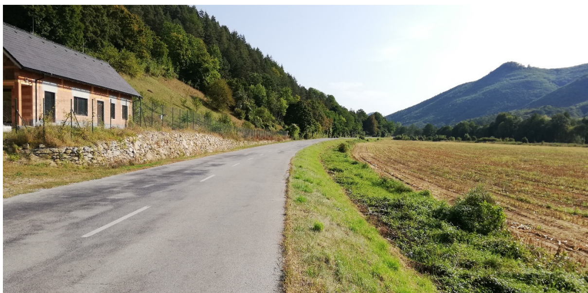
Foto 14 – Extravilán Slovenská Ľupča, pri ceste III/2427 V mieste charakteristického rezu VR A-14