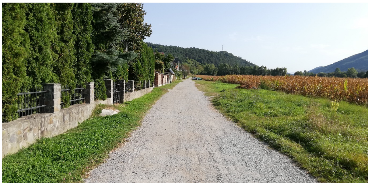
Foto 29 – Intravilán Slovenská Ľupča, ulica Záhradná V mieste charakteristického rezu SVR A2-4