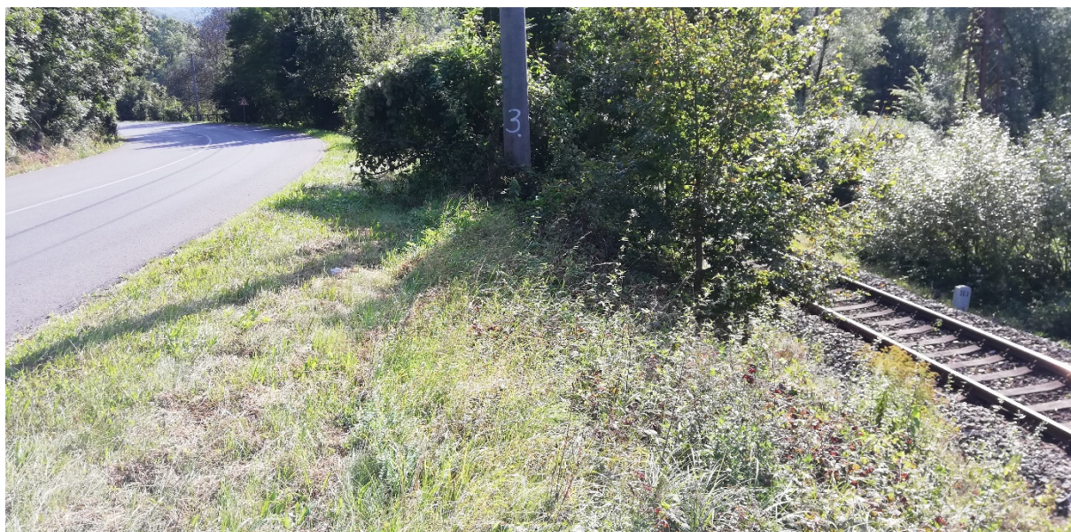
Foto 48 – Extravilán Lučatín, lokalita Predľubietová pri motoreste Grajciar, pravý breh Hrona V mieste charakteristického rezu VR B-11