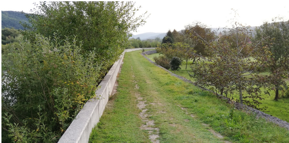
Foto 55 - Mestská časť Banská Bystrica – Šalková, hrádza na ľavom brehu Hrona V mieste charakteristického rezu SVR B1-1