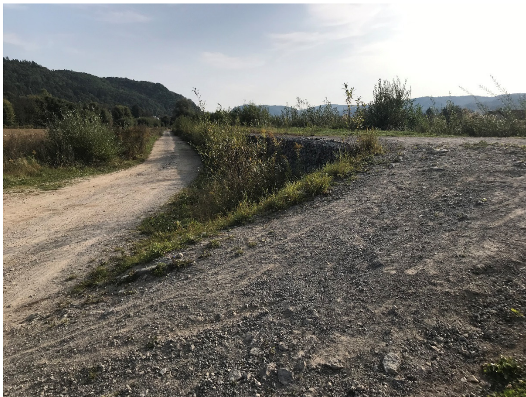
Foto 3 - Mestská časť Banská Bystrica – Šalková, poľná cesta pri hrádzi na pravom brehu Hrona V mieste charakteristického rezu VR A-3