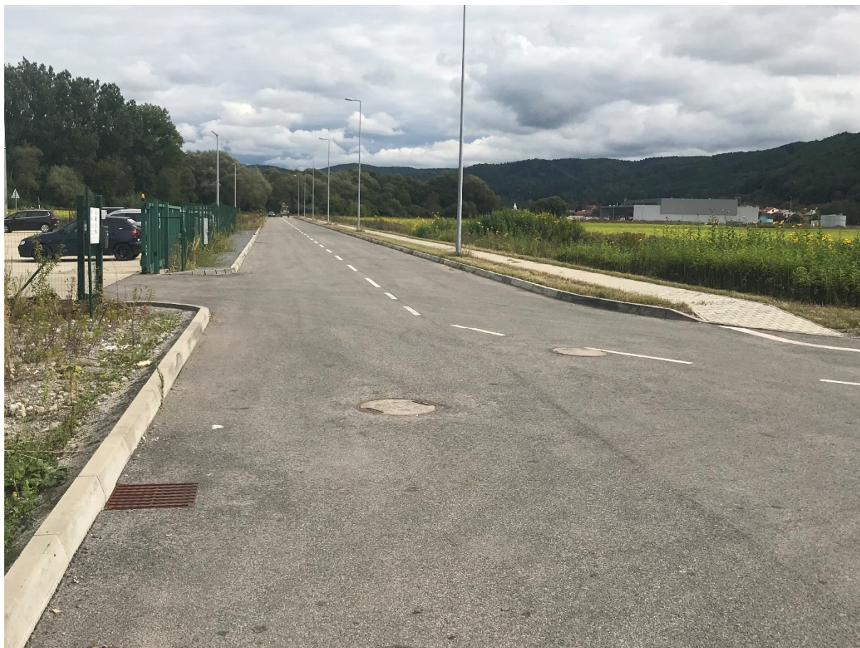
Foto 33 - Mestská časť Banská Bystrica – Šalková, Priemyselná ulica v priemyselnej zóne V mieste charakteristického rezu SVR A5-1