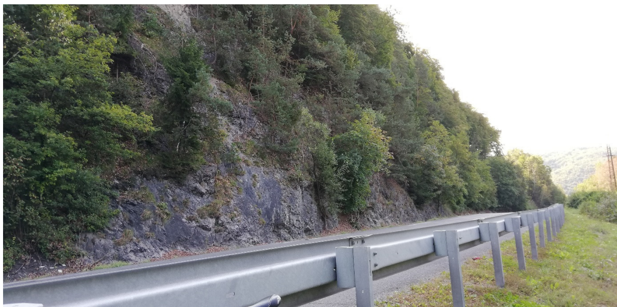
Foto 49 – rozhranie extravilánu obci Lučatín a Medzibrod, strmý skalný svah pri ceste I/66 V mieste charakteristického rezu VR B-12