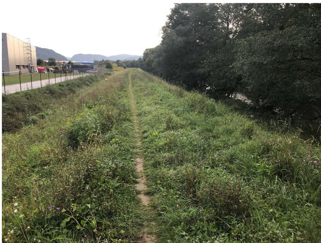
Foto 2 - Mestská časť Banská Bystrica – Šalková, nespevnená hrádza na pravom brehu Hrona V mieste charakteristického rezu VR A-2