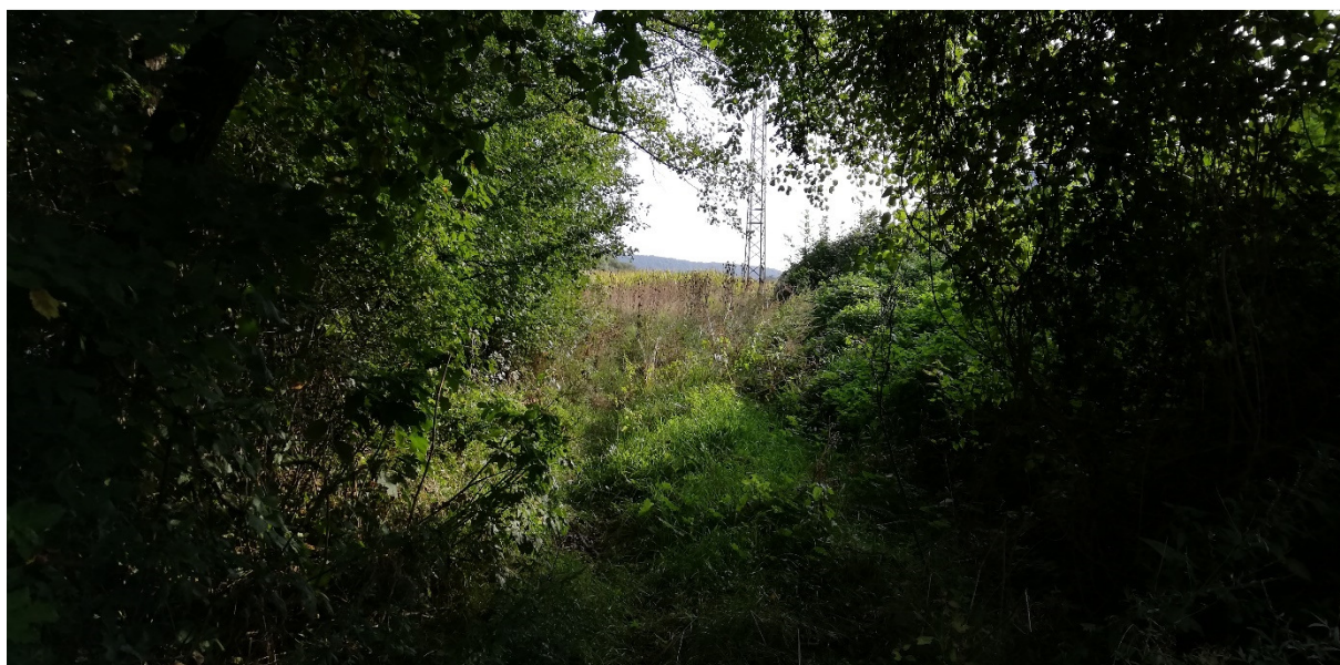
Foto 45 – Extravilán Slovenská Ľupča, ľavý breh Hrona neďaleko táboriska Mlynčok V mieste charakteristického rezu VR B-8