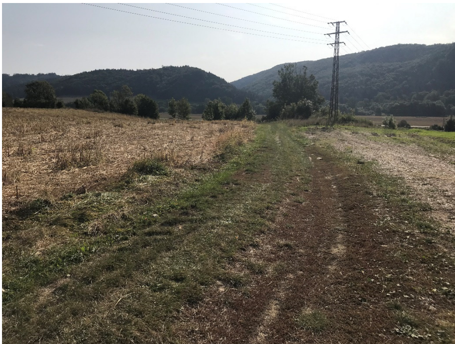
Foto 26 – Extravilán Slovenská Ľupča, ulica Partizánska V mieste charakteristického rezu SVR A2-1