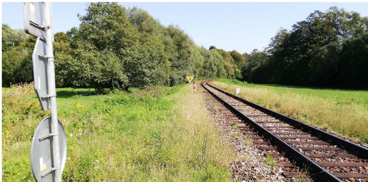
Foto 35 – Extravilán Brusno, železničná trať na pravom brehu Hrona, miestna časť Ondrej n/H V mieste charakteristického rezu SVR A7-1