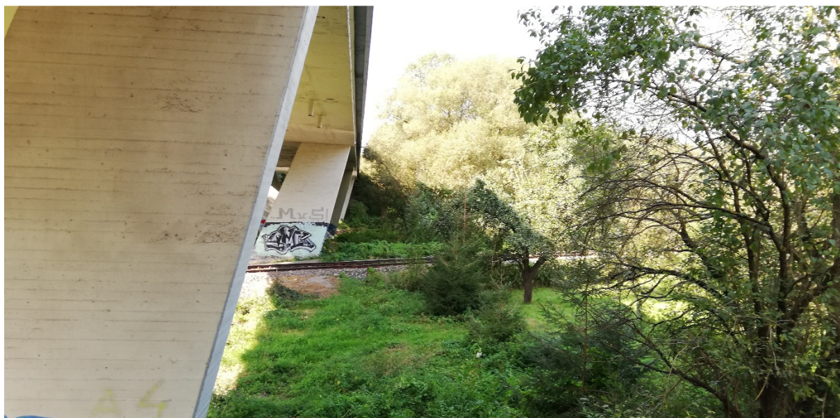
Foto 47 – Extravilán Lučatín, most na ceste I/66 ponad železniciu a rieku Hron, pravý breh Hrona V mieste charakteristického rezu VR B-10