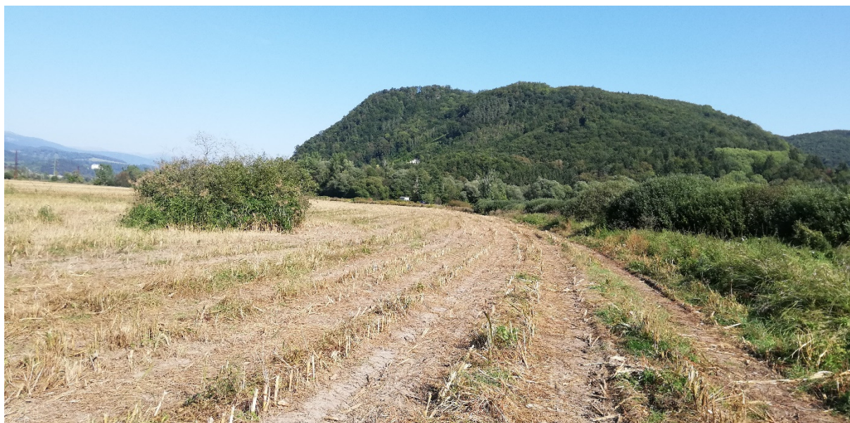
Foto 32 – Extravilán Slovenská Ľupča, lokalita pri trati ŽSR na okraji výhľadovej priemyselnej zóny V mieste charakteristického rezu SVR A4-2