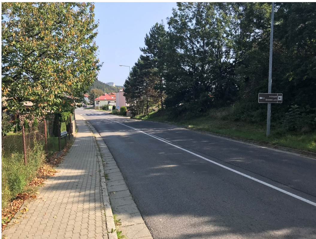
Foto 11 – Intravilán Slovenská Ľupča, prieťah cesty III/2427 obcou V mieste charakteristického rezu VR A-11