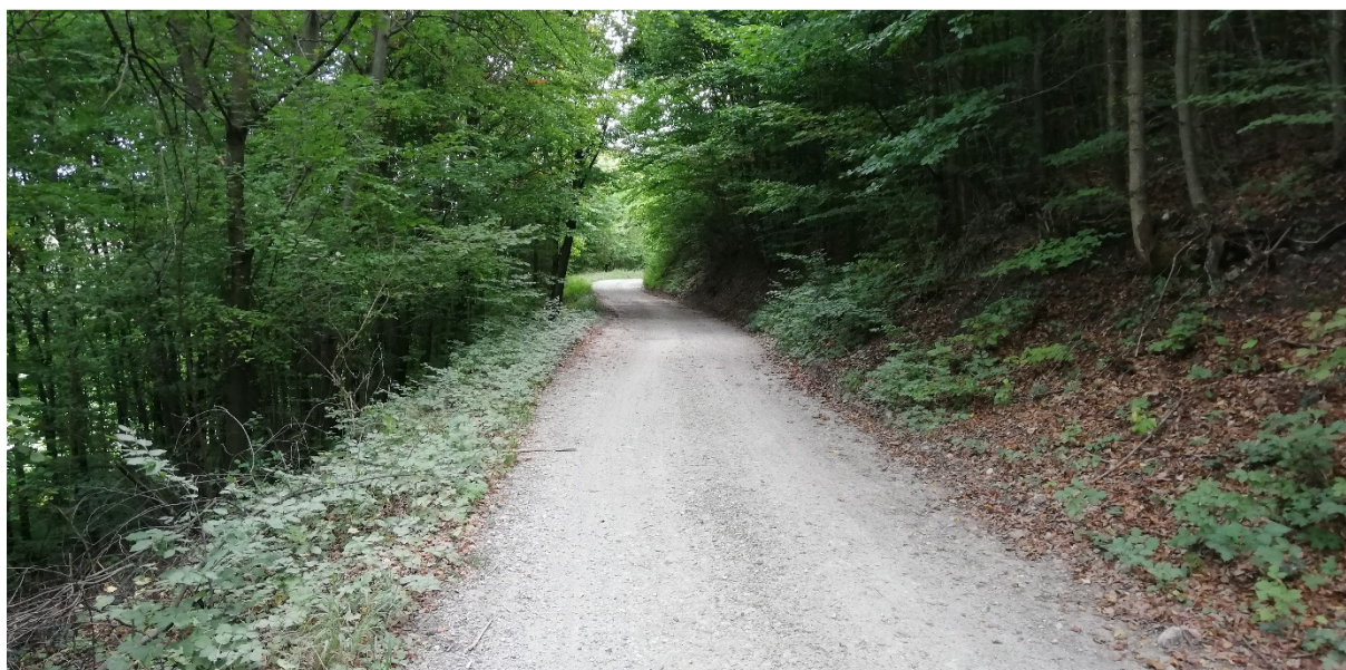
Foto 42 – Extravilán Slovenská Ľupča, lesná cesta neďaleko PR Šupín V mieste charakteristického rezu VR B-5