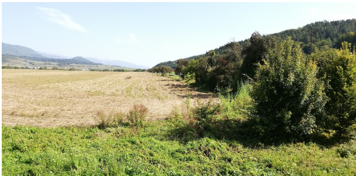
Foto 30 – Extravilán Medzibrod, lokalita pri trati ŽSR na okraji výhľadovej priemyselnej zóny V mieste charakteristického rezu SVR A3-1