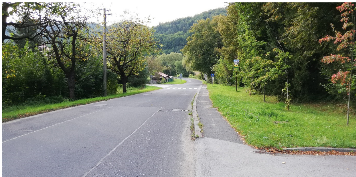
Foto 40 - Mestská časť Banská Bystrica – Šalková, prietáh cesty III/2420 intravilánom V mieste charakteristického rezu VR B-3