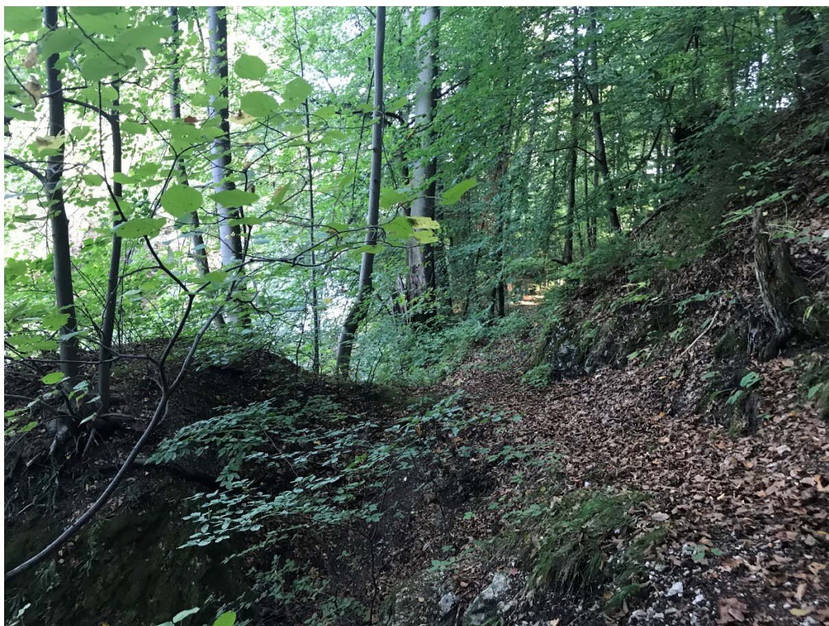
Foto 51 – extravilán Medzibrod, strmý skalný svah pri moste na ceste I/66 nad riekou Hron V mieste charakteristického rezu VR B-14