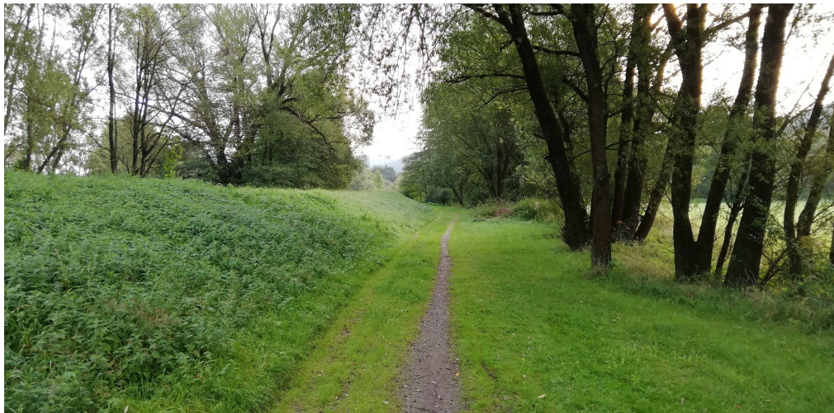
Foto 56 - Mestská časť Banská Bystrica – Šalková, poľná cesta pri hrádzi na ľavom brehu Hrona V mieste charakteristického rezu SVR B2-1