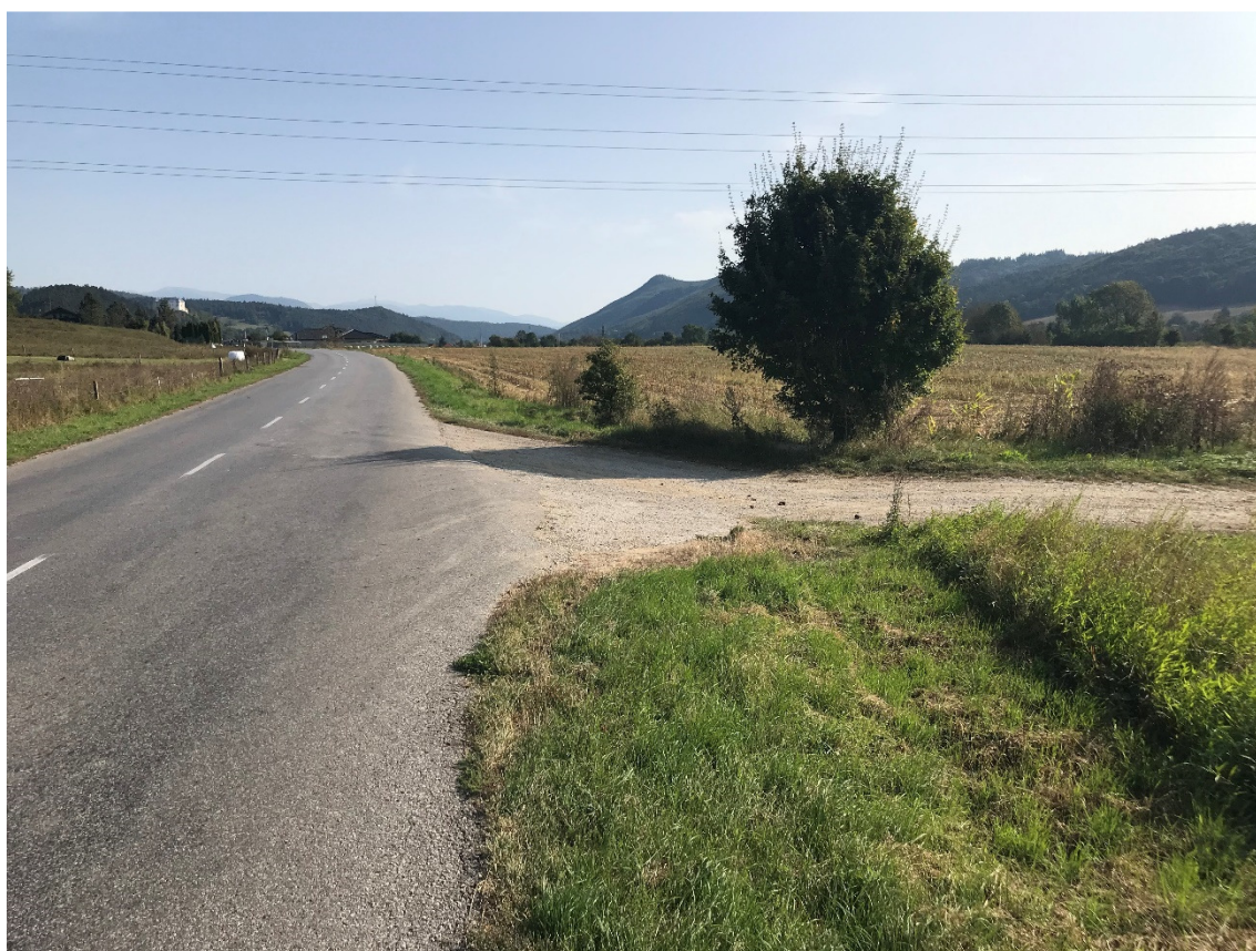
Foto 10 – Extravilán Slovenská Ľupča, zjazd z cesty III/2427 na ulicu Partizánsku V mieste charakteristického rezu VR A-10