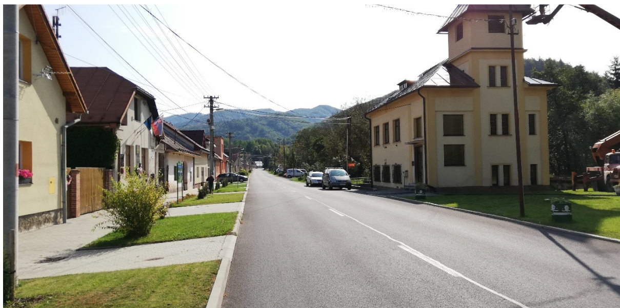
Foto 17 – Intravilán Lučatín, prieťah cesty III/2427 obcou V mieste charakteristického rezu VR A-17