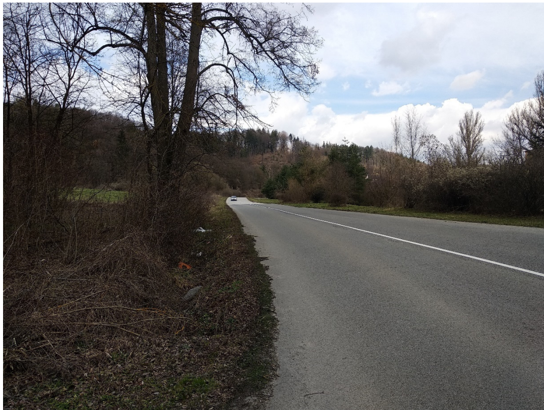
Foto 6 – Lokalita Príboj pri ceste III/2427, extravilán Slovenská Ľupča V mieste charakteristického rezu VR A-6