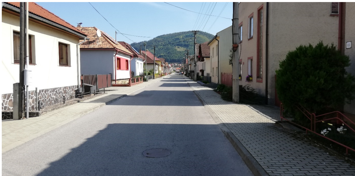
Foto 23 – Intravilán Brusno, miestna časť Ondrej nad Hronom, ulica Lúka V mieste charakteristického rezu VR A-23