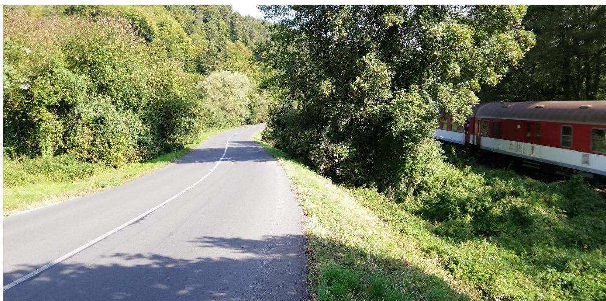
Foto 16 – Extravilán Lučatín, súbeh cesty III/2427 so železnicou V mieste charakteristického rezu VR A-16