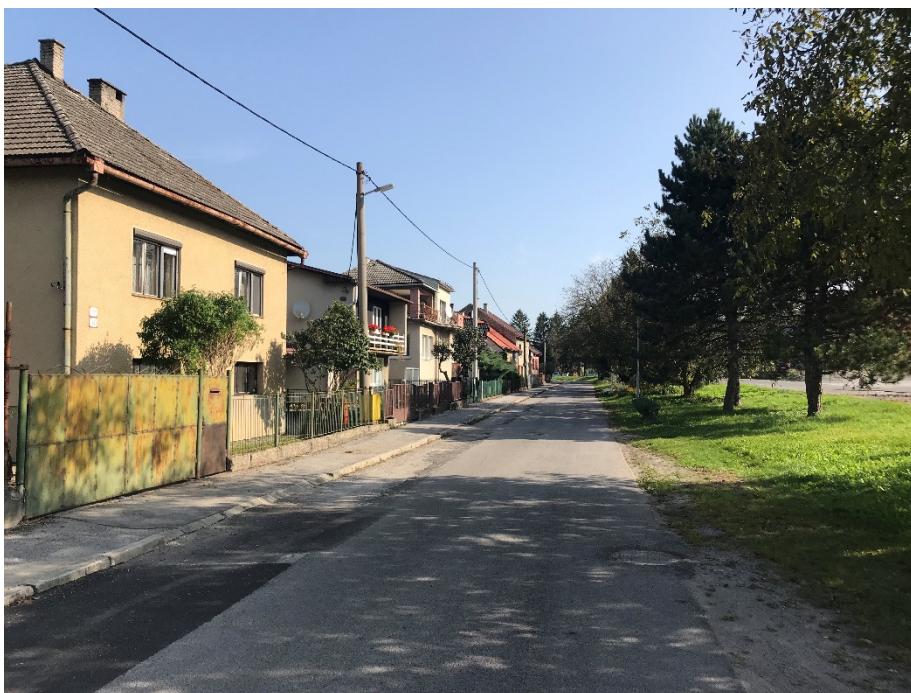
Foto 27 – Intravilán Slovenská Ľupča, ulica Partizánska V mieste charakteristického rezu SVR A2-2