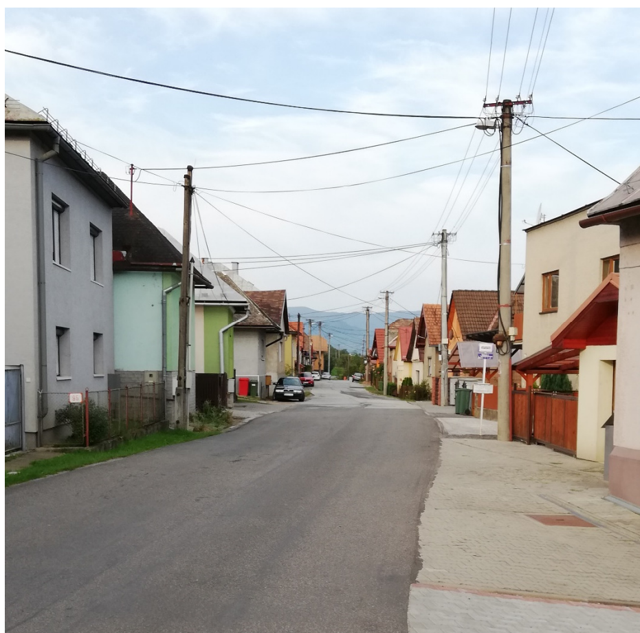
Foto 39 - Mestská časť Banská Bystrica – Šalková, miestna komunikácia – ulica Hronská V mieste charakteristického rezu VR B-2