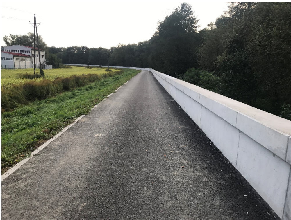
Foto 1 - Mestská časť Banská Bystrica – Majer, spevnená hrádza na pravom brehu Hrona V mieste charakteristického rezu VR A-1