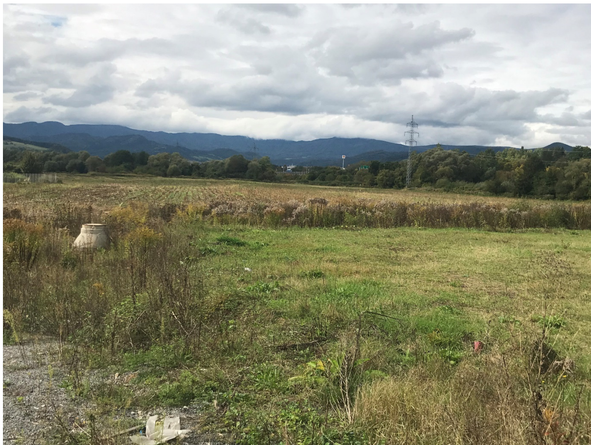
Foto 34 - Mestská časť Banská Bystrica – Šalková, okraj priemyselnej zóny V mieste charakteristického rezu SVR A6-1