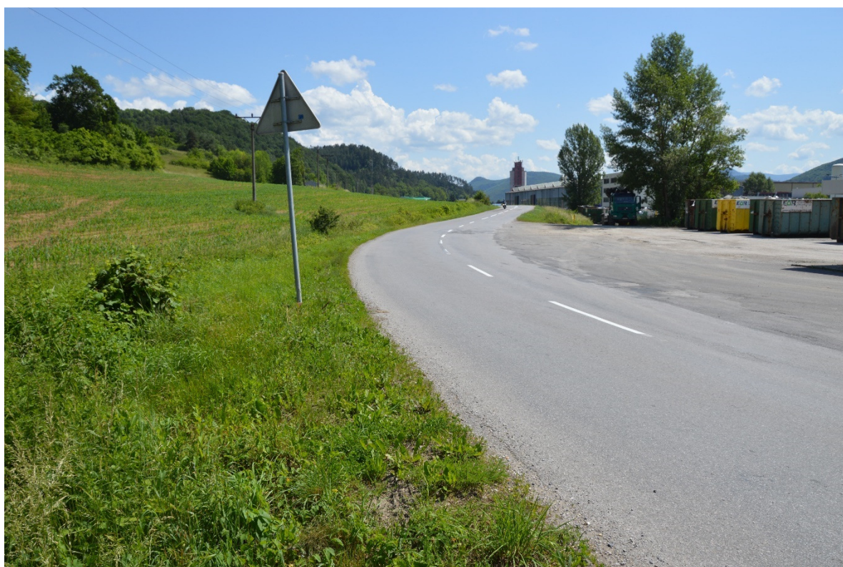
Foto 8 – Priemyselná zóna Slovenská Ľupča, cesta III/2427 V mieste charakteristického rezu VR A-8