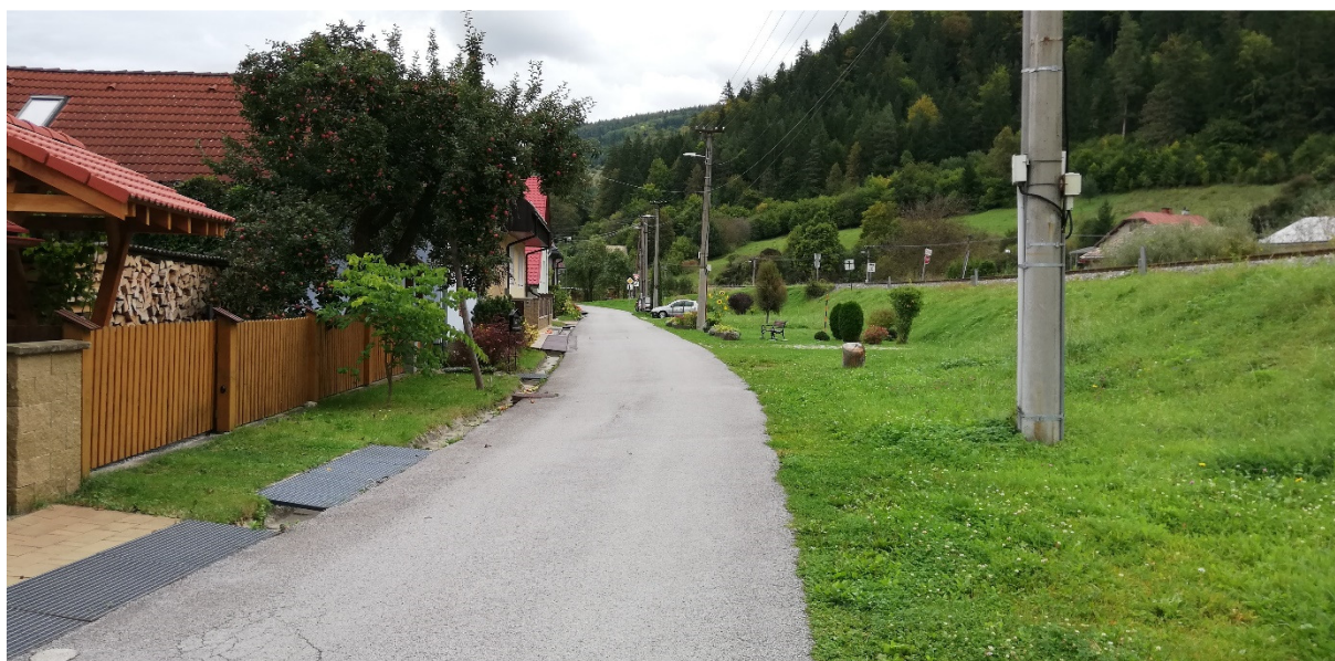
Foto 36 – Intravilán Brusno, ulica Okružná V mieste charakteristického rezu SVR A7-2