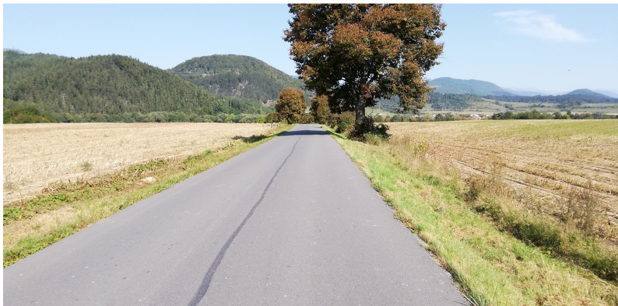
Foto 20 – Extravilán Medzibrod, cesta III/2429 V mieste charakteristického rezu VR A-20