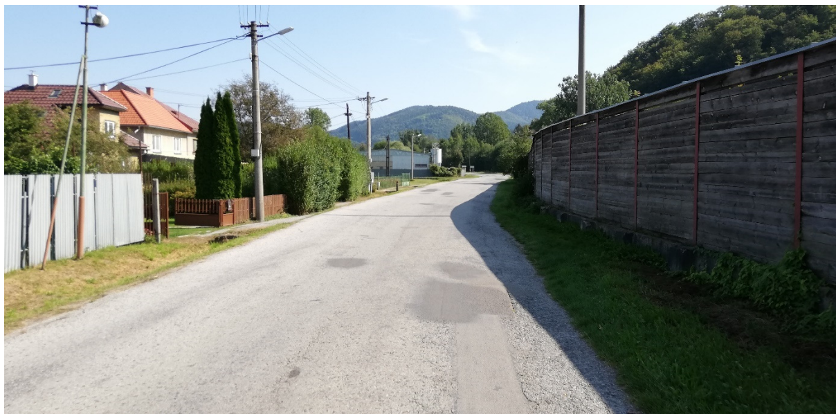
Foto 21 – Intravilán Medzibrod, cesta III/2429 V mieste charakteristického rezu VR A-21