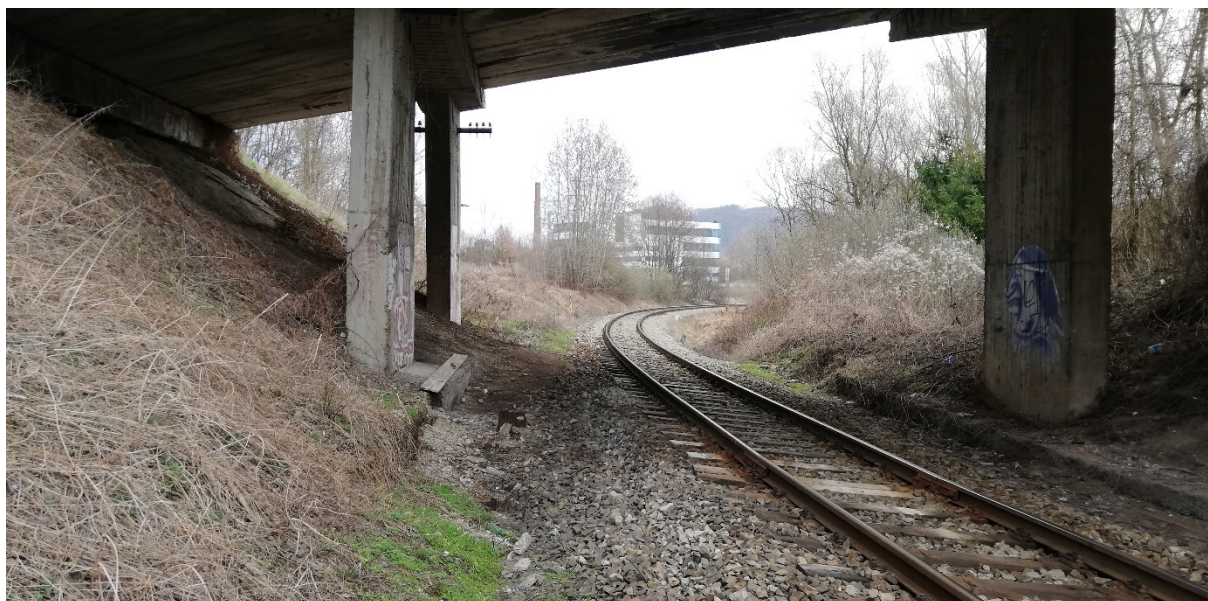
Foto 31 – Extravilán Slovenská Ľupča, lokalita Príboj pri moste na ceste III/2427 nad traťou ŽSR, na okraji priemyselnej zóny V mieste charakteristického rezu SVR A4-1