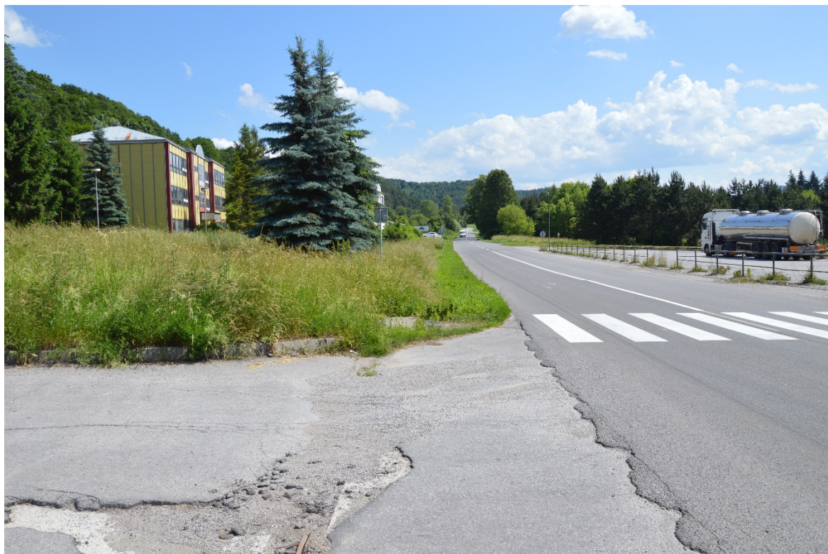
Foto 7 – Priemyselná zóna Slovenská Ľupča, cesta III/2427 V mieste charakteristického rezu VR A-7