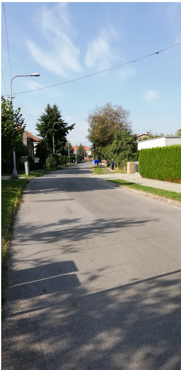
Foto 28 – Intravilán Slovenská Ľupča, ulica Lesnícka V mieste charakteristického rezu SVR A2-3