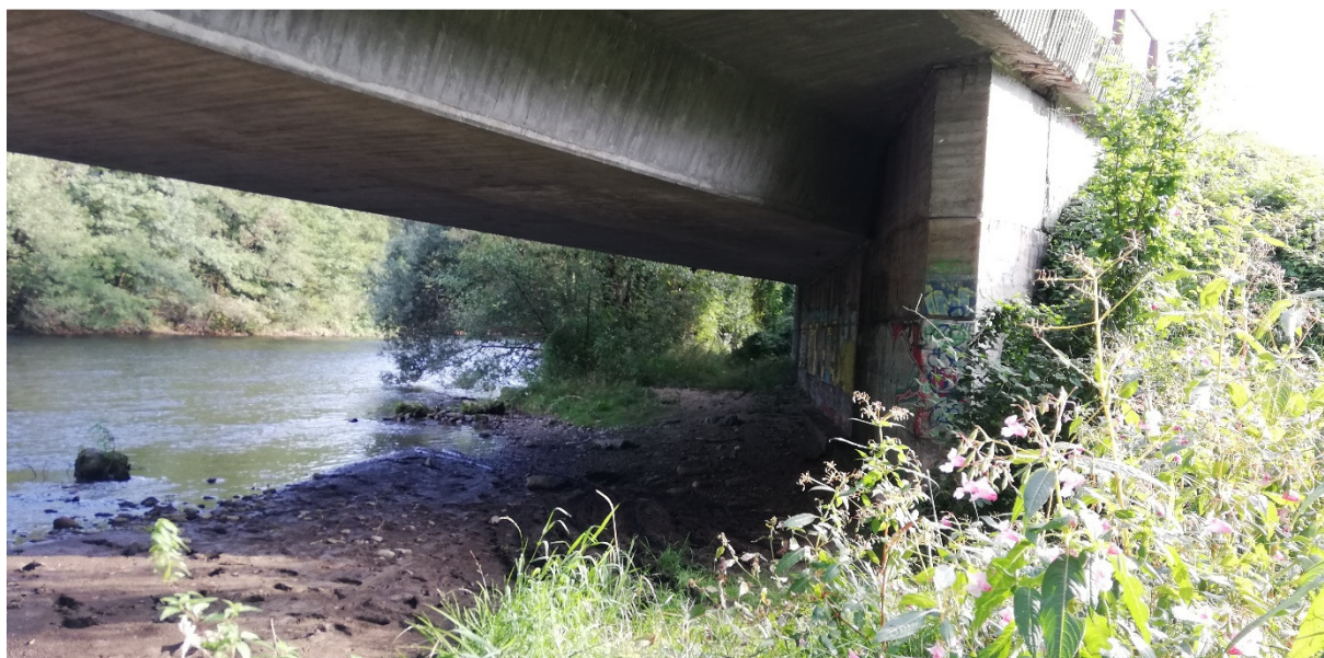
Foto 44 – Extravilán Slovenská Ľupča, most na ceste I/66 nad riekou Hron, ľavý breh Hrona V mieste charakteristického rezu VR B-7