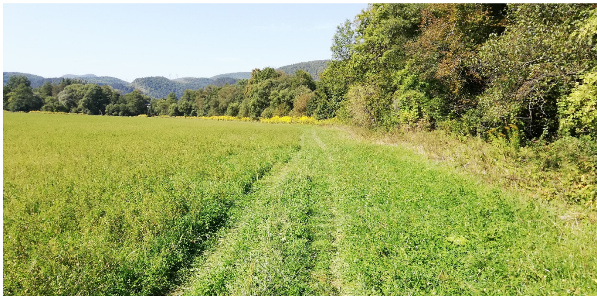
Foto 52 – extravilán Brusno, údolie Hrona, ľavý breh V mieste charakteristického rezu VR B-15