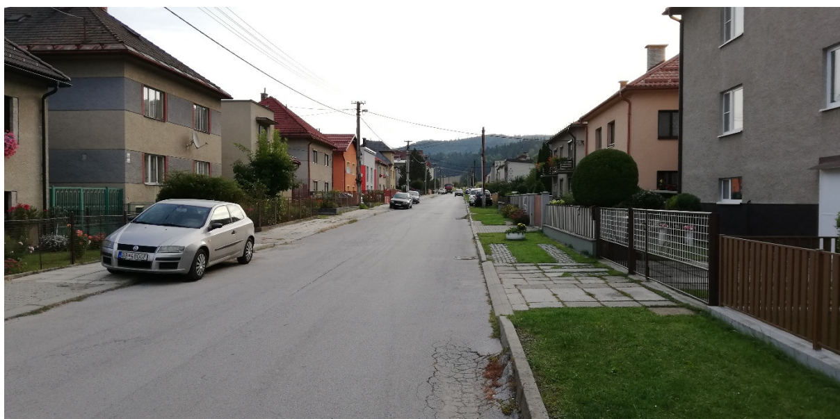
Foto 41 - Mestská časť Banská Bystrica – Šalková, miestna komunikácia – ulica Poľovnícka V mieste charakteristického rezu VR B-4