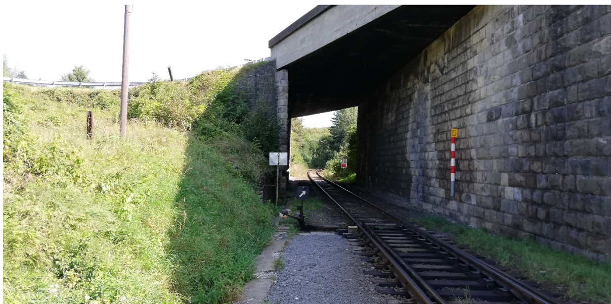
Foto 22 – Intravilán Medzibrod, križovatka ciest I/66 a III/2429, lokalita pretláčania pojazdu vedľa mosta ponad železnicu V mieste charakteristického rezu VR A-22