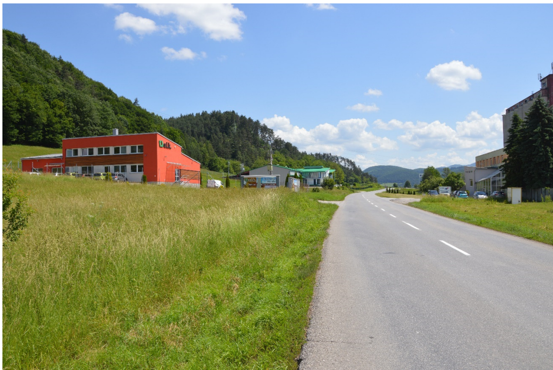
Foto 9 – Priemyselná zóna Slovenská Ľupča, cesta III/2427 V mieste charakteristického rezu VR A-9